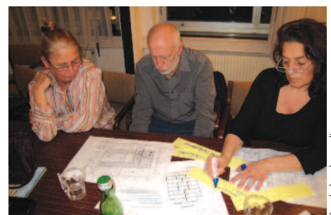
Zukünftige BewohnerInnen der „Wohngruppe für Fortgeschrittene“ in der Steinbruchstraße in Wien-Ottakring (Bauträger Neue Heimat) beim Planungsworkshop für ihr Gemeinschaftswohnprojekt.